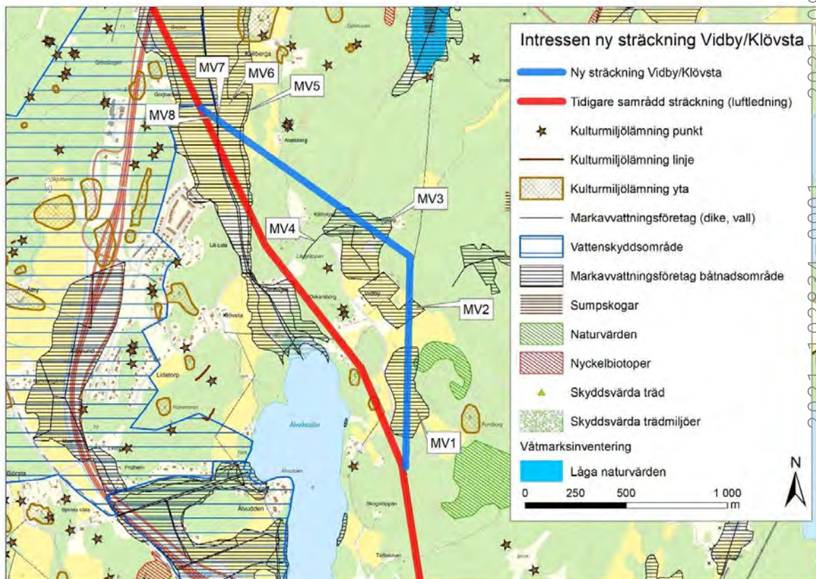
Figur 2. Intressen ny sträckning Vidby/Klövsta.

Ny ledningssträckning berör inga detaljplaner eller fördjupade översiktsplaner. Markanvändningen på sträckan utgörs av både skogs- och jordbruksmark. Åtta områden med markavvattningsföretag berörs, se Figur 2 och Tabell 1. Sträckningen korsar en väg samt två mindre skogsbilvägar. Korsningar med vägar kommer att ske i enlighet med gällande lagstiftning.